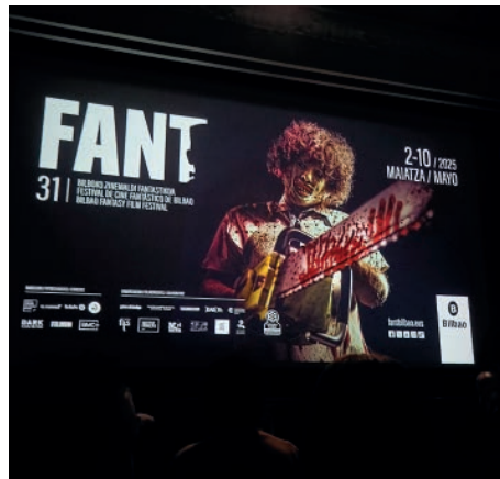
Fant aurkezpena